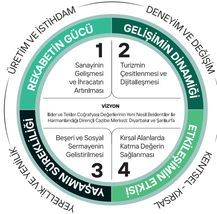
Tablo 2: TRC2 Düzey 2 Bölgesi 2024- 2028 Bölge Planı: Bölge Vizyonu

Bölge vizyonuna ulaşmak için bölgesel kalkınmaya yön verecek stratejik öncelikler altında hedefler ve tedbirler ortaya konmuştur. Stratejik öncelikler özetle aşağıdaki gibidir.